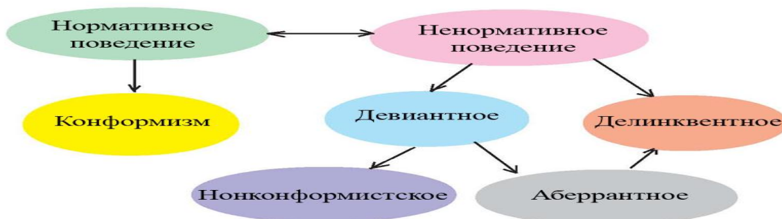
Рисунок 1 – Аберрантность в типологии социального поведения

При этом аберрантность конкретизирует все четыре основных формы девиации – инновацию, ритуализм, мятеж, эскапизм – с точки зрения утверждения активной индивидуальной мотивации поведения, направленной на установления права на личностные предпочтения и противопоставления личности сложившемуся социальному порядку.