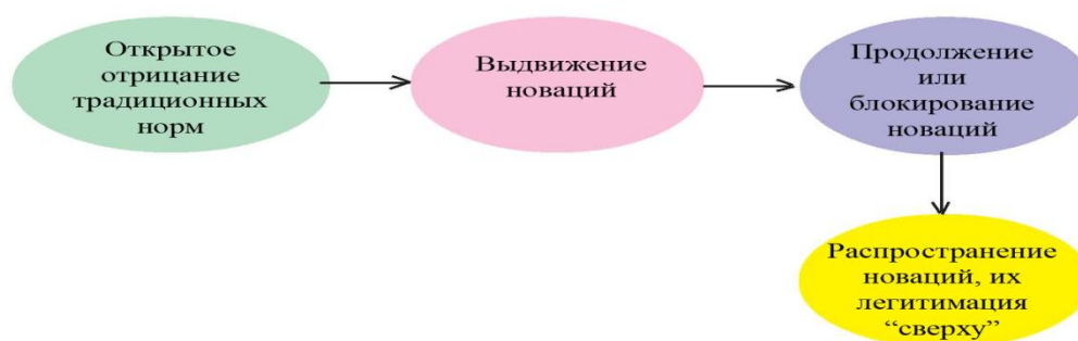
Рисунок 4 – Генезис неконформистского поведения в обществе риска

Само понятие нормативных новаций имеет широкое приложение. Его можно отнести к ученым, выдвигающим новые научные парадигмы, изобретателям, реализующим оригинальные технологические решения; религиозным деятелям, предлагающим собственные трактовки добра и справедливости; художникам или писателям, изобретающим новый творческий стиль; предпринимателям, реорганизуящим производство или торговлю; политикам или правителям, вводящим новый кодекс законов, и т. д. В каждом случае ниспровержение прежних норм и правил начинается с проявления творчества, оригинальности, с отхода от существующих общепринятых традиций. Между тем моментом, когда выдвигается какая-то новация, и временем, когда она становится, наконец, общепринятой, замещая господствовавшие прежде предписания, представления и нормы лежит значительная дистанция. Процесс, как мы видим на рис.4 , может быть разбит на четыре стадии, и каждая стадия полна случайностей: процесс может продолжиться, а может и застопориться, достичь конечной фазы морфогенеза или остановиться на полпути.