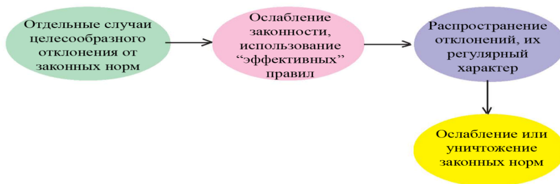
Рисунок 3 – Генезис аберрантного поведения в обществе риска

Все три формы институционализированного отклонения ведут к конечной фазе морфогенеза — установлению властями новых норм или приобретению последними статуса санкционированных, полностью легитимных и встроенных в новую нормативную структуру».